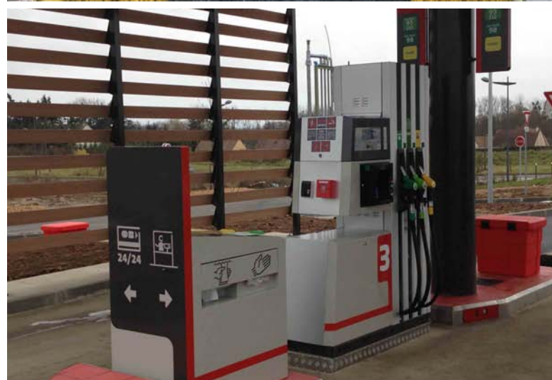
Distributeurs de carburant